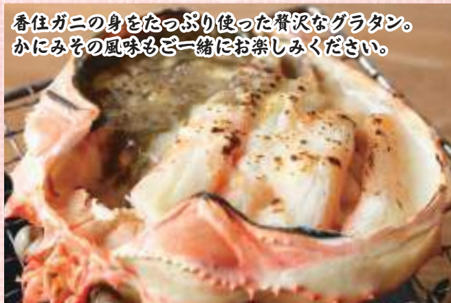
盛々カニ甲羅グラタン (かにみそ入り) 税込1,650円

香住ガニの身をたっぷり使った贅沢なグラタン。 かにみその風味もご一緒にお楽しみください。