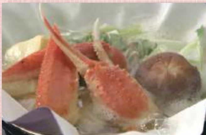
かにすき1人鍋 税込1,210円