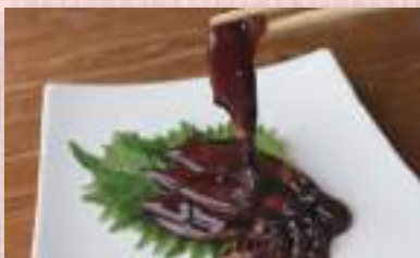
ほたるいか 醤油漬け