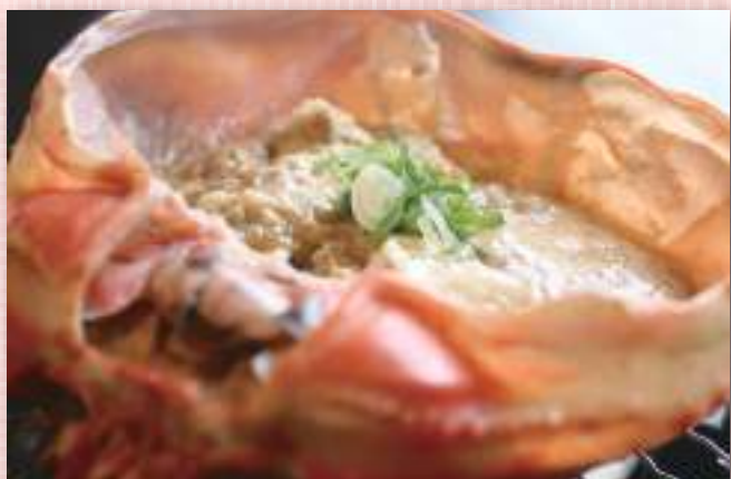
かにみそ甲羅焼き 税込1,100円