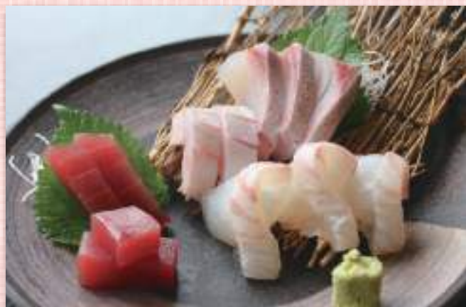
お造り3種盛 税込1,760円