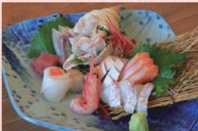
刺身盛合わせ 税込2,420円