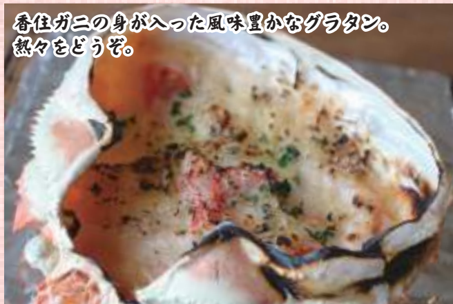
カニ甲羅グラタン 税込1,100円