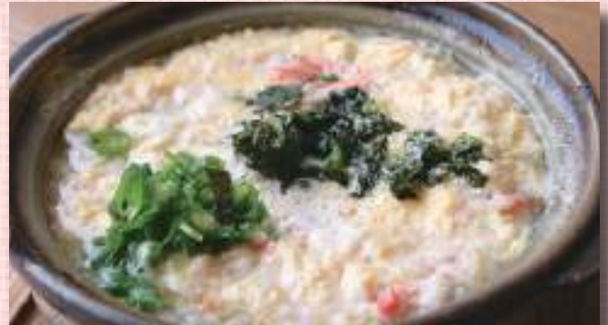
かに雑炊 税込 1,650 円