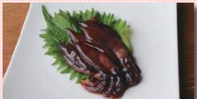
ほたるいか醤油漬け 税込 605 円