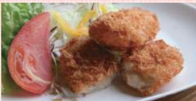
かにクリームコロッケ 税込 770 円