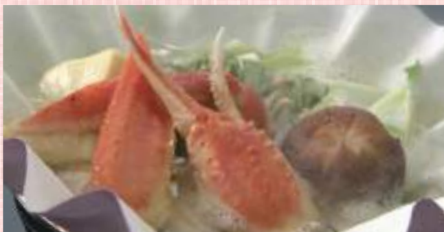
かにすき一人鍋 税込 1,210 円