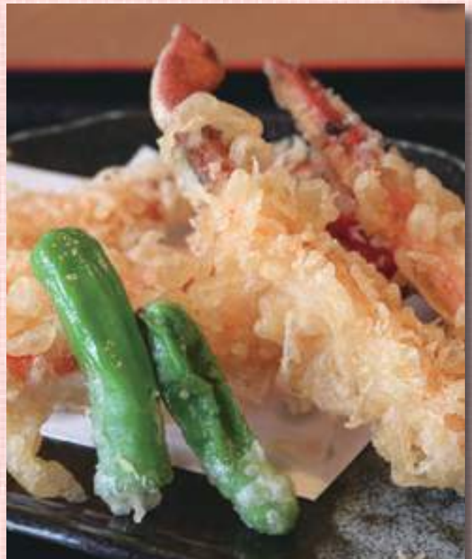
かに天ぷら 税込 2,310 円