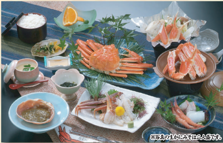
※写真の生かにみそは二人盛です。