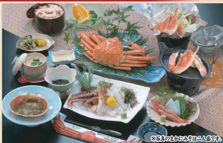
※写真の生かにみそは二人盛です。