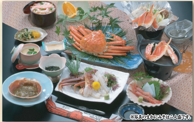
※写真の生かにみそは二人盛です。