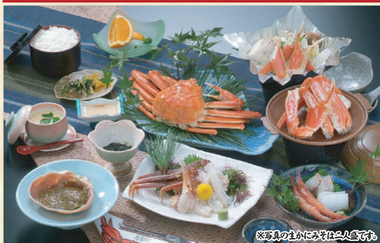
※写真の生かにみそは三人盛です。